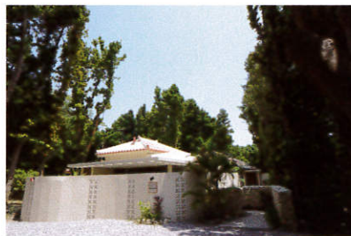
赤瓦の屋根が印象的。プライベート感を大切にするため、壁も高く作られている。

●Private Villas TOKUASAGI / 沖縄県本部町備瀬492 ☎098-840-1881 http://www.okinawavilla.net/ 料金 1棟貸し、1泊29,800円～（税込）