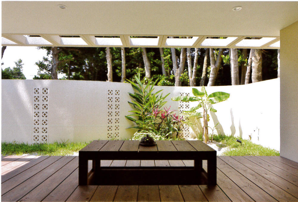
杉の板で作られたウッドデッキテラス。備瀬のフクギに囲まれて穏やかな時間が過ごせる場所だ。

備瀬は御嶽（うたき）がいくつもあ、神聖なる場所だ。フクギに囲まれて、目と耳で自然を感じながらゆっくりと過ごすのも、ひとつの贅沢ではないだろうか。